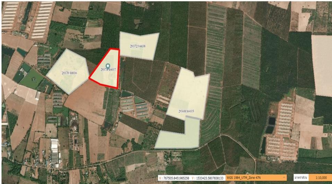
พื้นที่คำขอประทานบัตรที่ 2/2552